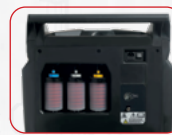
Hermetische hervulbare containers