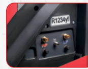
Stikstof lek test